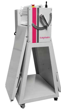
Position rangement Storage position