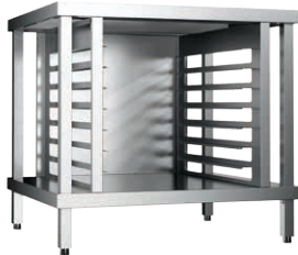
OPTION : support avec glissières OPTION: support with slides